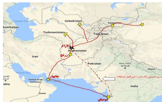
شکل ۴: دالان ایران در ورود هند به افغانستان و آسیای مرکزی