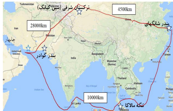
شکل ۳: برخی از مزایای نسبی بندر گوادر برای چین (ورود به خلیج فارس، جایگزینی برای بندر شانگهای، چشم‌پوشی از مسیر پرخطر و طولانی تنگه مالاکا و نظارت بر منطقه واگرای قومی سین کیانگ)

و عمرانی) در افغانستان از جمله مواردی است که باعث وابستگی متقابل منافع ایران و هنداند و به خودی خود زمینه‌های همکاری و تعامل دو سویه دو کشور را فراهم آوردند. ایران می‌تواند با فعال کردن چابهار، صرف نظر از مزیت‌های مرتبط با سیاست خارجی و امنیت بین‌المللی، یک امنیت پایدار را در این منطقه سامان دهد (عسکری کرمانی، ۱۳۹۵).