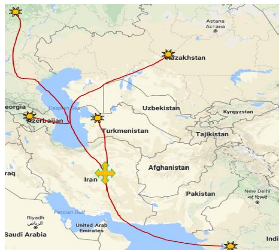
شکل ۵: دالان ایران در ورود هند به کشورهای حوزه خلیج فارس

از ایران به هرات افغانستان را خواهد ساخت. جز خط آهن سرخس-تجن، ایران راه آهن ۱۰۰۰ کیلومتری بافق-مشهد را در سال ۲۰۰۴ م. تکمیل کرد که سفر از آسیای مرکزی به خلیج فارس را دو روز کوتاه‌تر می‌کند. تکمیل یک شبکه راه آهن پیشرفته و کارآمد، روسیه، چین، هند و جمهوری‌های حاشیه دریای خزر را به استفاده از مسیر ایران برای حمل‌ونقل کالاهای