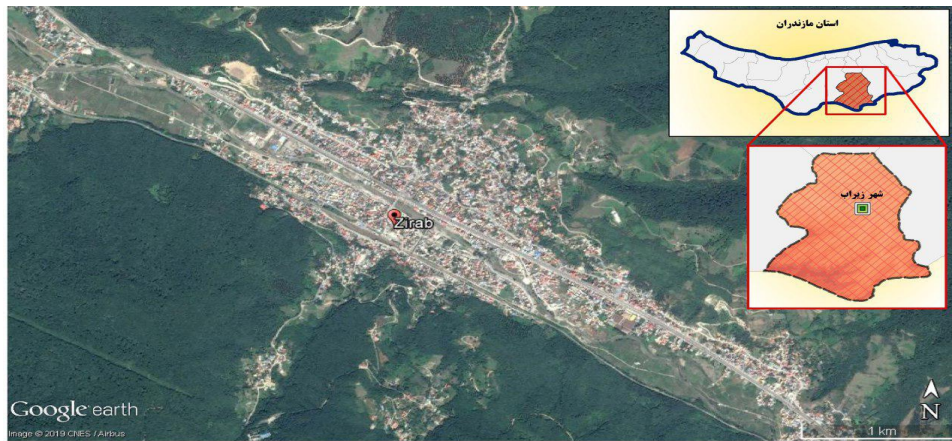
شکل ۱: موقعیت منطقه مورد مطالعه

توازن جنسی، کاهش امنیت و زوال فرهنگ سنتی را نیز به وجود آورده است (قادری و اعرابی، ۱۳۹۸).